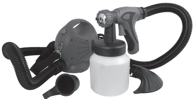
Рис. 1. Внешний вид 79-545